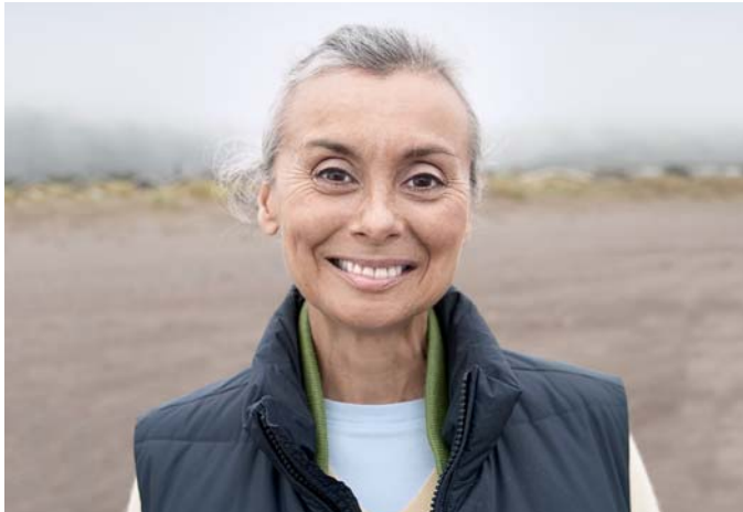
Stabile und gesunde Zähne spielen eine wichtige Rolle für die Gesundheit und das Wohlbefinden.

Herausnehmbare Prothesen sind eine konventionelle Behandlungsmöglichkeit für vollständig zahnlose Kiefer. Sie halten durch Unterdruck oder Haftmittel auf der Mundschleimhaut. Konventionelle Prothesen können Schmerzen verursachen, unbequem und unpraktisch sein. Diese Art von Zahnersatz kann beim Kauen bestimmter Speisen auch Probleme bereiten. Sie müssen also eventuell auf einige Speisen verzichten, die Sie bisher gern gegessen haben. Schlecht sitzende Prothesen können sich auf die Aussprache, das Geschmackempfinden und damit auf die Lebensqualität negativ auswirken.